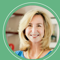
Kerry Healey Presidenta de Babson College